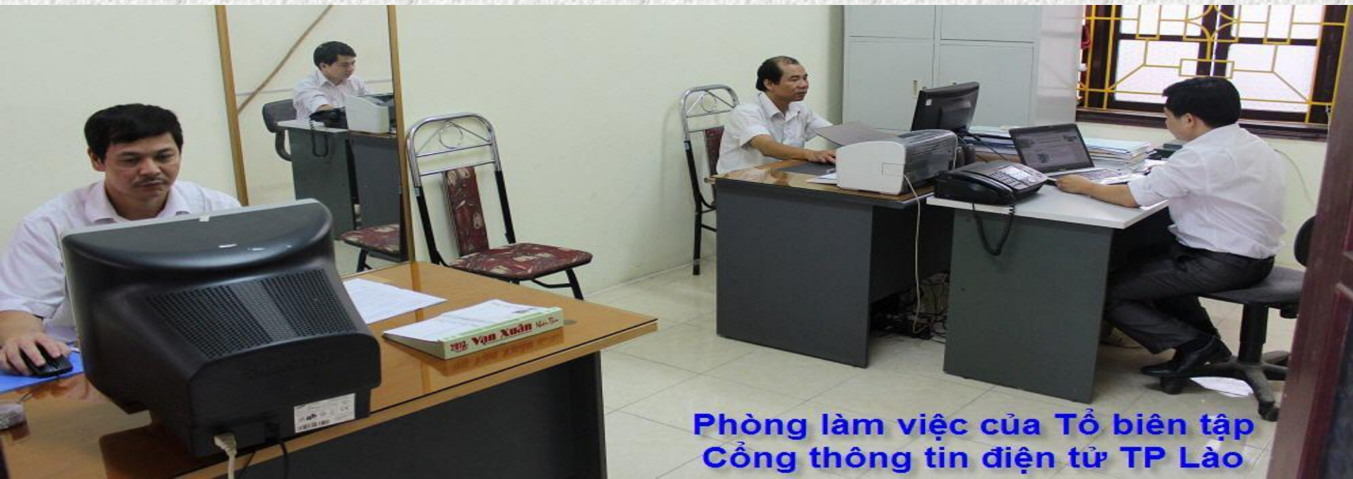
Phòng làm việc của Tổ biên tập Cổng thông tin điện tử TP Lào

Ngay từ năm 2001 thành phố Lào Cai (khi đó là thị xã Lào Cai) đã đầu tư hàng trăm triệu đồng để triển khai mạng LAN nội bộ giữa Thành ủy, HĐND, UBND và các phòng, ban, đoàn thể thành phố. Đến nay, gần 100% cán bộ của Thành ủy, HĐND-UBND và các phòng, ban, đoàn thể thành phố đã được trang bị máy vi tính có kết nối Internet tốc độ cao để làm việc.